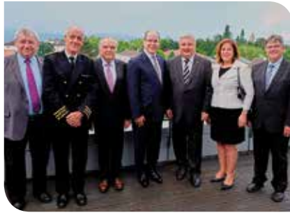
Catherine Troendlé est venue à la rencontre de Albert II, prince souverain de Monaco sur les terres alsaciennes le 7 juin 2016.