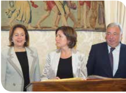
Catherine Troendlé a accueilli au Sénat, aux côtés du président Gérard Larcher, Malu Dreyer, présidente du Bundesrat le 3 novembre 2016.