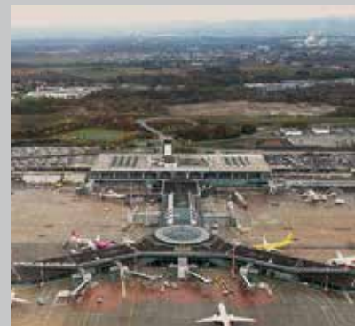
Euroairport : Aéroport tri-national Basel - Mulhouse - Freiburg

Ce dossier en souffrance pesait depuis juin 2013 comme une épée de Damoclès sur les collectivités et les entreprises concernées par la décision gouvernementale d'appliquer la fiscalité française aux entreprises du secteur suisse. Il y a quelques mois, face à l'inertie, Catherine Troendlé avait demandé qu'une table ronde soit organisée, réunissant tous les acteurs locaux impliqués dans l'emprise de la plate-forme aéroportuaire. Pour autant, le maintien de ce statut juridique devra véritablement s'inscrire dans la durée, permettant davantage de consolider le rayonnement de la région trinationale par son fleuron économique qu'est l'EuroAirport. La vigilance est plus que jamais de mise : elle sera totale !