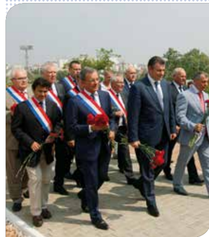
Dépôt de fleurs au cimetière des soldats français de Sébastopol.